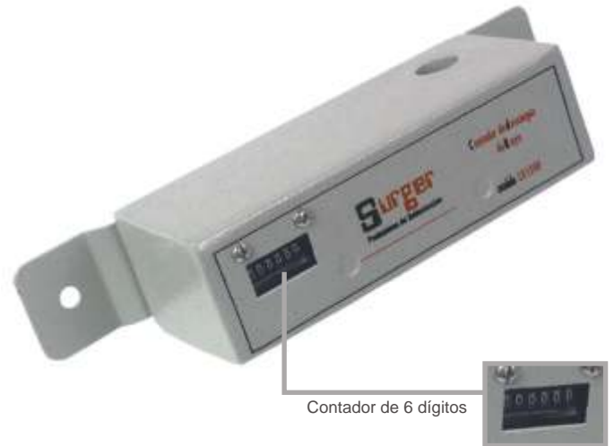
Contador de 6 dígitos

Permite el mantenimiento preventivo del sistema de protección contra el rayo (spcr) visualizando el estado Del contador. Como lo recomienda la norma.